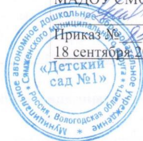
График проведения плановых заседаний ППк на 2024/ 2025 учебный год.